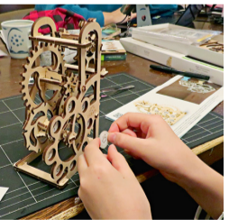
最近流行っているウッドクラフト(聖性がクラフト系は真)

帰り後すぐに痛み止めを服用して横になると、疲労と副作用により翌朝まで眠り込んでしまった。その後もう日間、痛みが苛まれたのだった。健康第一だ。