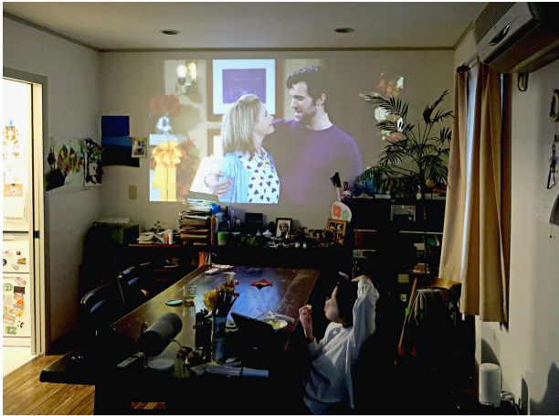
妻が借りてきたプロジェクターで「フラワーハウス」を観賞(32インチモニターを普段使っているため家庭で手軽な大迫力)

三月後半は春休みの始まりだが、不登校の子にはあまり関係なく、来月になれば自動的に5年生に進級するという、なんとも言えない年度末。